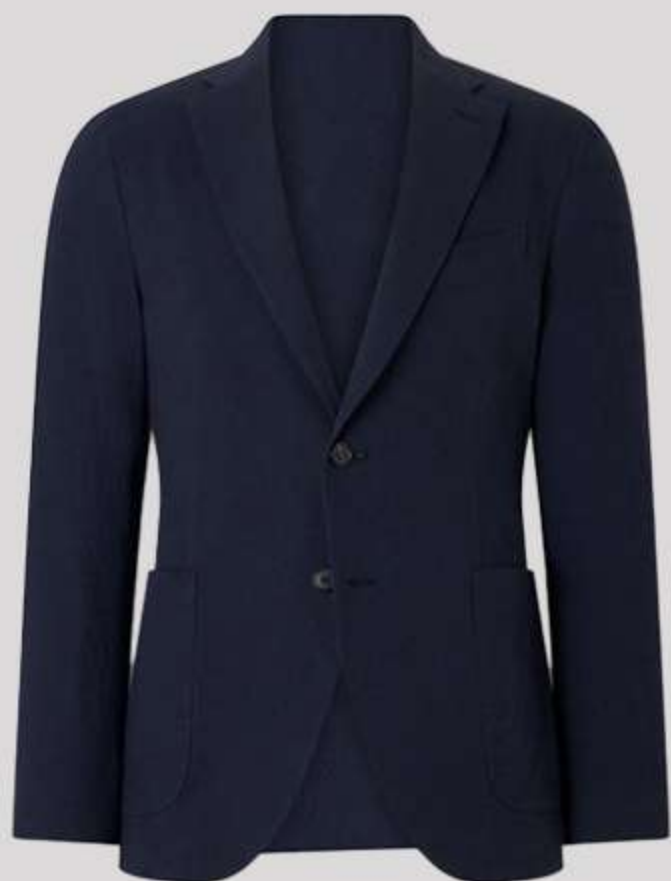
کت تک بلیزر (لینن) سرمه ای