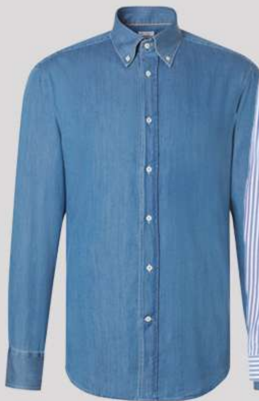
پیراهن جین کاغذی (دکمه پایین)