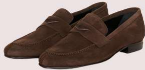
لوفر قهوه ای جنس جیر