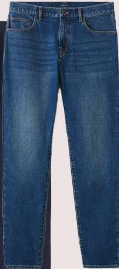
شلوار آبی میانه