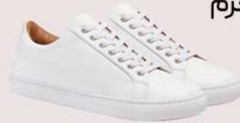
کتانی سفید چرم